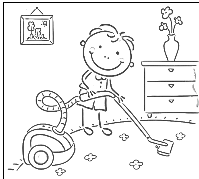
membantu ibu bapa melakukan kerja rumah