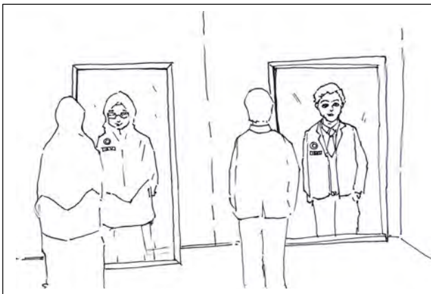
Menjaga Penampilan Diri