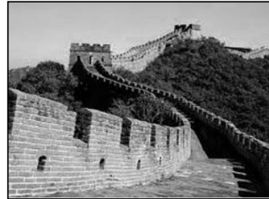
Tembok Besar China