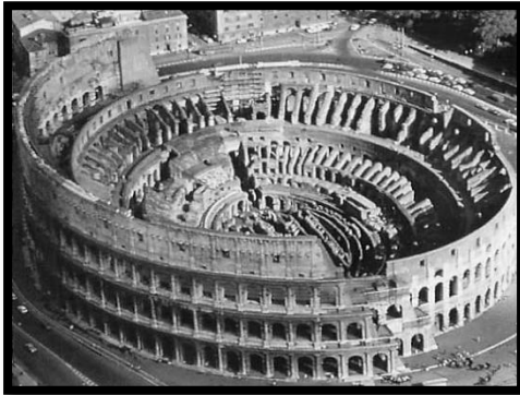
X Gambar 1

1 Soalan 1 berdasarkan gambar 1 dan gambar 2 di bawah.