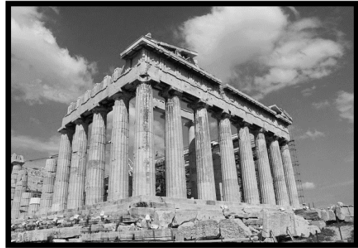
Y Gambar 2

(a) Berdasarkan gambar 1 dan 2 di atas, namakan seni bina yang bertanda :