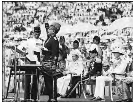
Tunku Abdul Rahman mengisytiharkan pemasyhuran kemerdekaan Tanah Melayu