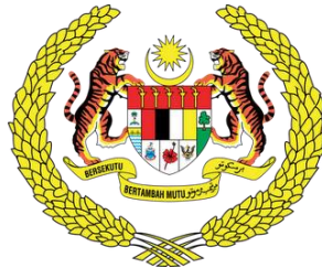
Gambar Jata Negara

(a) Apakah maksud yang terdapat pada lambang berikut: