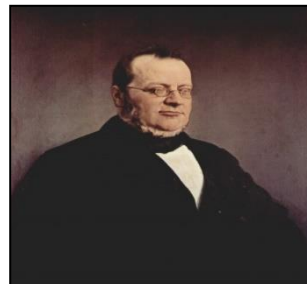
Camillo Benso di Cavour