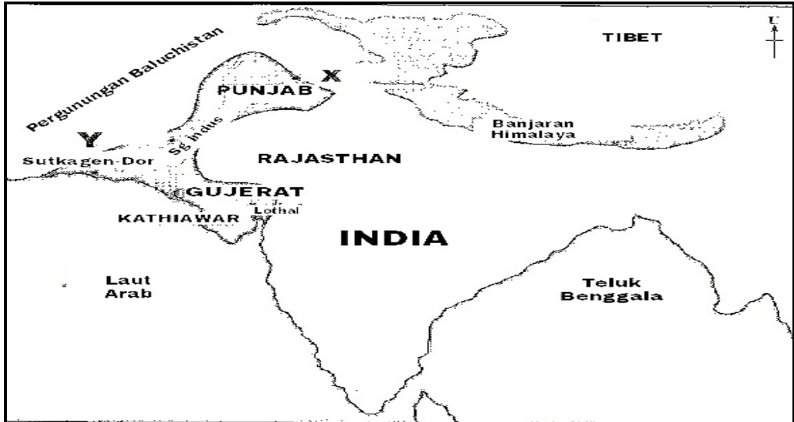
Peta 1 Tamadun Indus

1 (a) Berdasarkan peta 1 namakan bandar di