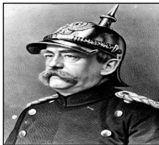
Otto Eduard von Bismarck

9 Tokoh-tokoh berikut telah menggunakan amalan realpolitik semasa pembentukan negara bangsa di Jerman dan Itali pada abad ke-19.