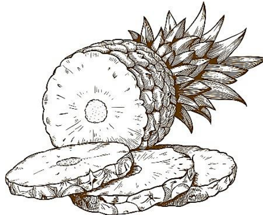
Rajah 2 Diagram 2

Eksperimen ini diulang dengan menggunakan jus buah nenas di atas. Ramalkan hasil eksperimen ini Terangkan ramalan anda. This experiment is repeated by using ripe pineapple. Predict the outcome of this experiment. Explain your prediction.