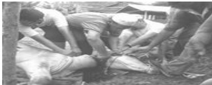
Gambar aktiviti sembelihan