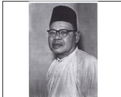
Gambar 1 : Zainal Abidin bin Ahmad (Zaaba)