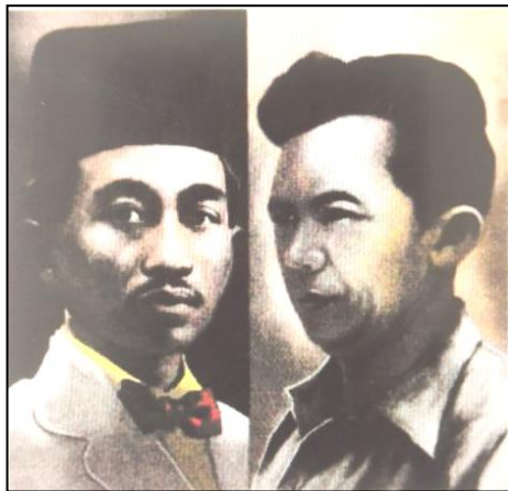
Ilustrasi Alimin dan Tan Malaka

Mengapakah fahaman komunis ditolak oleh orang Melayu?