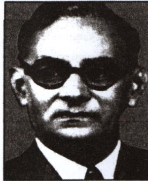
Gambar 1: Dato' Onn Jaafar

Apakah pendapat beliau berkaitan maksud nasionalisme?