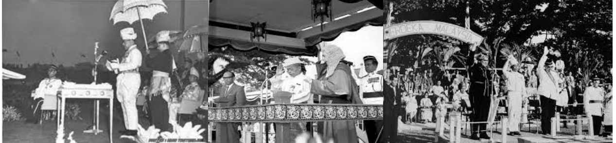
Istiadat Pengisytiharan Malaysia 1963.