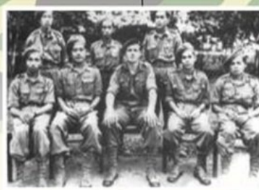
Gerila Melayu Kedah