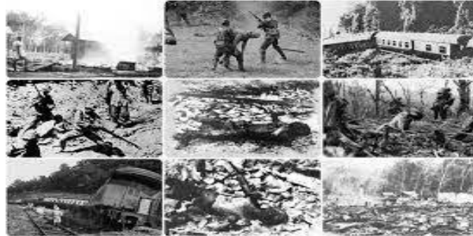
Kemusnahan akibat serangan Komunis