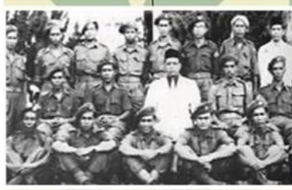
Pasukan Wataniah Pahang