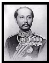
Gambar 1 Raja Chulalongkorn

4 Gambar 1 dan Gambar 2 menunjukkan tokoh nasionalisme di Asia Tenggara.