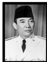
Gambar 2 Soekarno

Apakah persamaan kedua-dua tokoh tersebut?