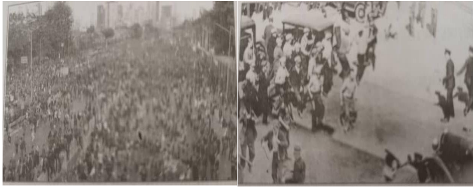
Gambar 1 Rusuhan Kaum 13 Mei 1969

4 Gambar 1 menunjukkan tragedi berdarah yang berlaku di negara kita.