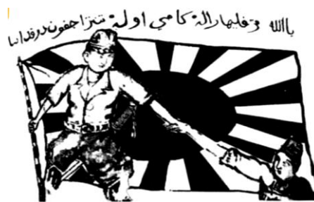
Poster propaganda tentera Jepun tertera dalam tulisan Jawi. "Ya Allah, terpeliharalah kami oleh tentera Jepun daripada aniaya".