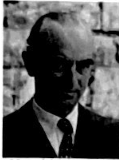
Sir Harold MacMichael