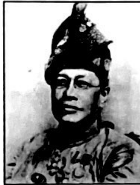
Raja Chulan Raja Abdullah

Apakah tuntutan tokoh tersebut terhadap British?