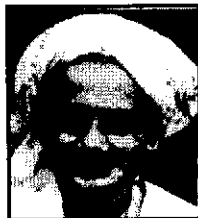
Sheikh Abdullah Fahim

18. Apakah sumbangan tokoh berikut terhadap peristiwa bersejarah negara?