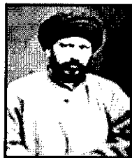
Sayyid Jamal al-Din al-Afghani

20. Tokoh berikut mentakrifkan kemerdekaan ialah perjuangan menghadapi penjajah.