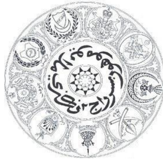
Cap Mohor Besar Raja-Raja