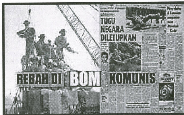
Sumber : Utusan Malaysia, 07 Jun 1974