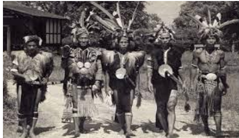
Sarawak Rangers (Iban Trackers)

11 Gambar berikut berkaitan pasukan keselamatan yang ditubuhkan untuk menangani ancaman komunis.