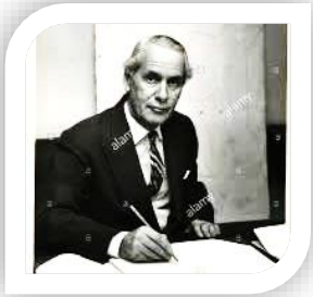
Sir Malcom MacDonald

(a) Apakah cadangan yang dikemukakan oleh tokoh berikut?