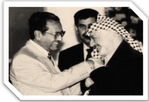
Kunjungan Yasser Arafat pejuang Pertubuhan Pembebasan (PLO) Palestin

Jelaskan pendirian Malaysia dalam kedua-dua isu tersebut dan berikan hujah sebab pemimpin negara kita mengambil pendirian sedemikian. [ 8 markah]