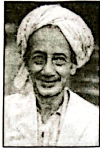
Sheikh Abdullah Fahim

20. Gambar berikut merupakan ulama terkenal dari Kepala Batas, Pulau Pinang.