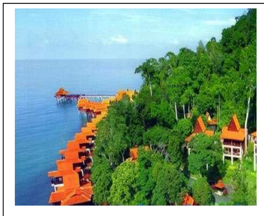
Kemajuan sektor pelancongan