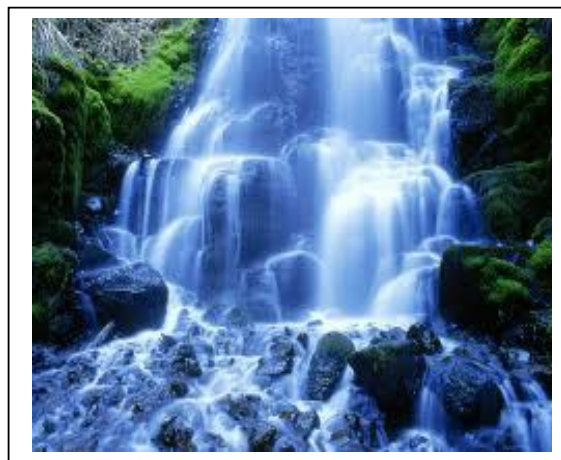
Sumber bekalan air bersih