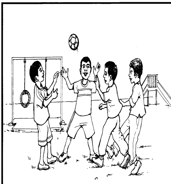
Sentiasa berada dalam kumpulan