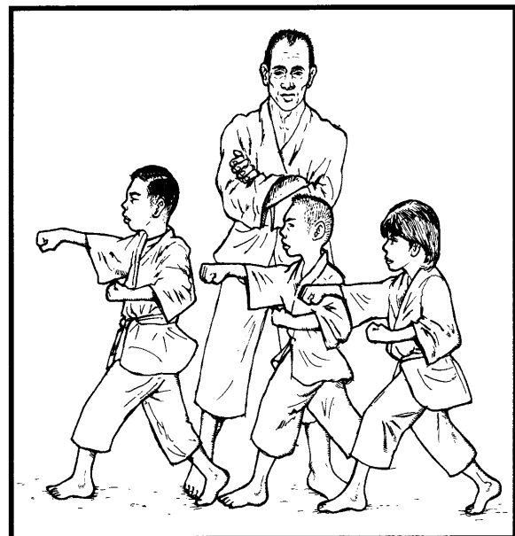
Mempelajari ilmu pertahanan diri