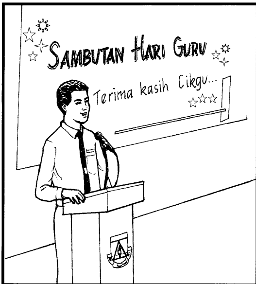
Menghargai jasa guru