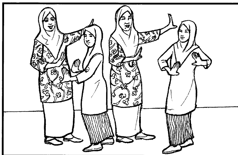
Mengeratkan hubungan dengan guru