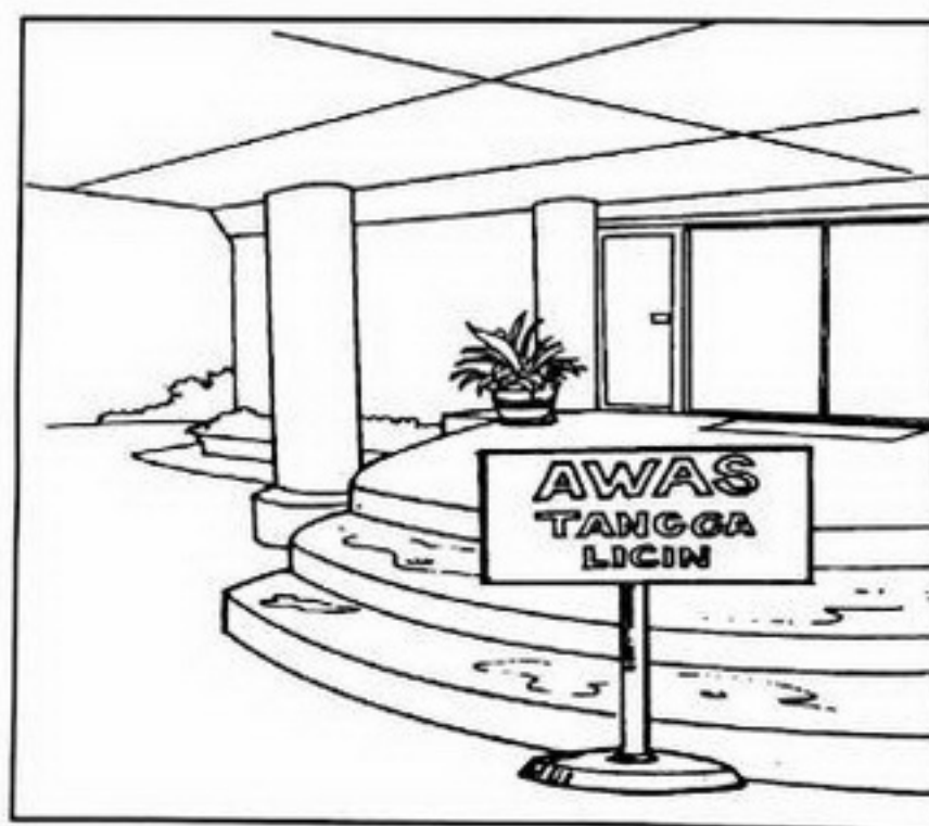
Papan Tanda Amaran